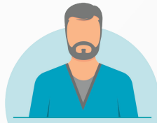
Therapy and Rehabilitation