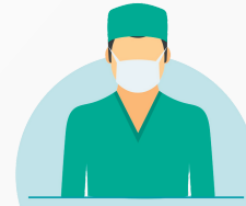
Technicians and Health Assistants