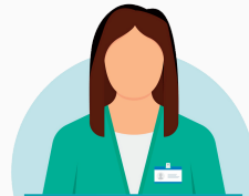
Nursing and Midwifery