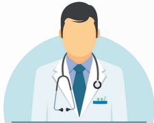
Medicine and Surgery