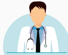
Health Administration and Community Health