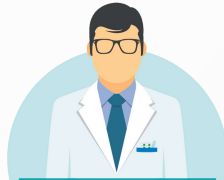
Pharmacists and Pharmacy Technicians