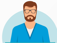
Dentistry and Related Specialties