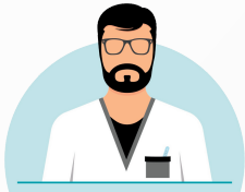
Laboratories and Medical Technologies